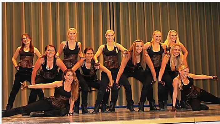
Die Tanzgruppe Dynamite des TSV Überlingen am Ried bei ihrem Auftritt mit dem Titel „Meine Gang“ an der Turnschau des Vereins in der Riedblickhalle

Am Samstag, den 24.10.2015 fand in der Überlinger Riedblickhalle die Turnschau des TSV Überlingen am Ried statt. In den Bereichen Turnen, Tanz und Gymnastik präsentierten sich die einzelnen Gruppen schwungvoll, dynamisch und emotional. Die kurzweilige Show war gespickt mit den unterschiedlichsten Themendarbietungen. So zeigten die Turnerinnen der Wettkampfgruppe eine gespenstische Halloween-Turnakrobatik. Die Übungsleiterinnen des Vereins bildeten eine eigene Gruppe und konnten einen „feschen und zünftigen“ Auftritt zum Titel „Rock me“ von voXXclub hinlegen. Gefühlvoll und die Sinne ansprechend war die Darbietung „Beat the Heat“ der Tanzgruppe „Sense2Dance“. Ins Milieu der „Gangs“ versetzte der Auftritt der Tanzgruppe Dynamite. Die HipHop-Kids zeigten einen peppigen HipHop-Mix aus der schwarzen Funk- und Soul-Musik. Wie sie sich in den Tag hineinbewegen zeigte die Gruppe „Fit in den Tag“ zum Titel „Let me go“. Mit viel Power und Lebensfreude tanzten die Zumba-Tänzerinnen zu motivierender Musik. Es gab auch zwei turnerische Gastauftritte der Spitzenturner aus Güttingen. Sie hatten klassische Turngeräte wie Kasten, Barren, Trampolin und den Boden spielerisch, effektiv und gekonnt im Griff.