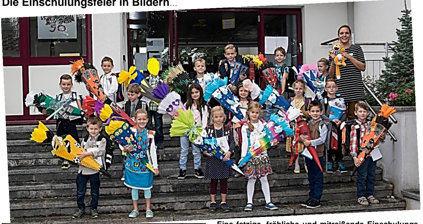
Eine fetzige, fröhliche und mitreißende Einschulungsfeier gab es zu Beginn des neuen Schuljahres. Hier einige Eindrücke...