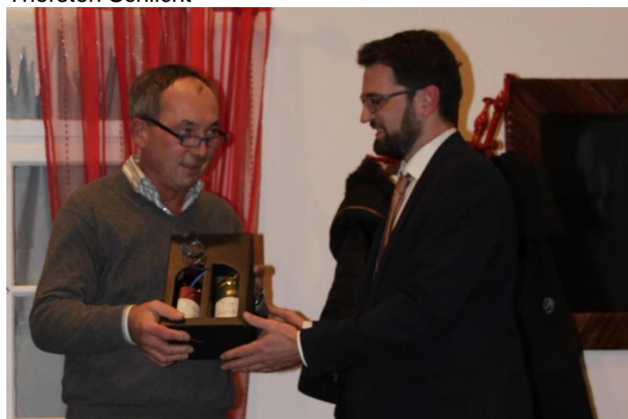
Dank an Regisseur: Lothar Deininger, Thorsten Schlicht