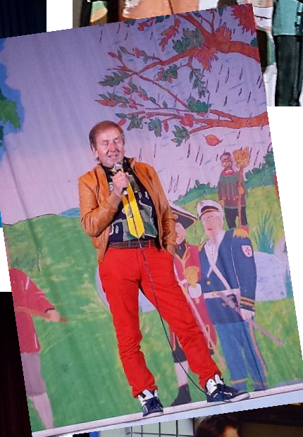
Impressionen vom Narrenspiegel