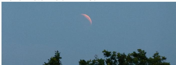
21.15 Der Mond ist schon fast verdeckt – diesige Sicht