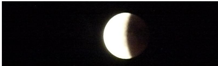
23.45 Mehr als die Hälfte des Mondes ist wieder sichtbar 30-f. Zoom