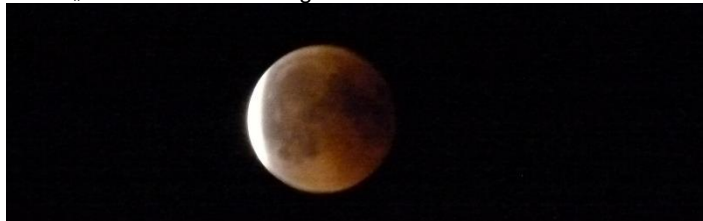
23.15 Der Mond tritt aus dem Erdschatten