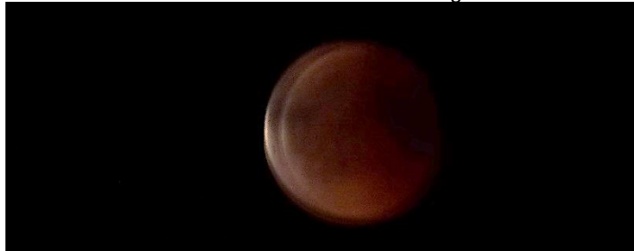
22.30 „Blutmond“-noch völlig im Erdschatten