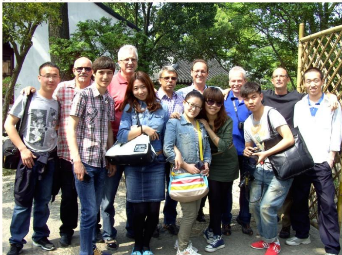
Immer wieder waren wir bei den Chinesen begehrte Objekte für ein gemeinsames Foto

Was auffällt: die Chinesen streben sehr nach westlichen Werten. Deutsche Autos der Premiumklasse sind Statussymbole und werden auch dementsprechend gezeigt. In China herrscht ein grosser Wettbewerb unter den Menschen. Jeder will der Beste, der Erste oder der Schnellste sein. So kommt es nicht von ungefähr, dass die aufstrebende Mittelschicht der Chinesen nach dem Motto lebt: lieber krank vom Arbeiten und einen BMW fahren, als gesund und ein Fahrrad besitzen.