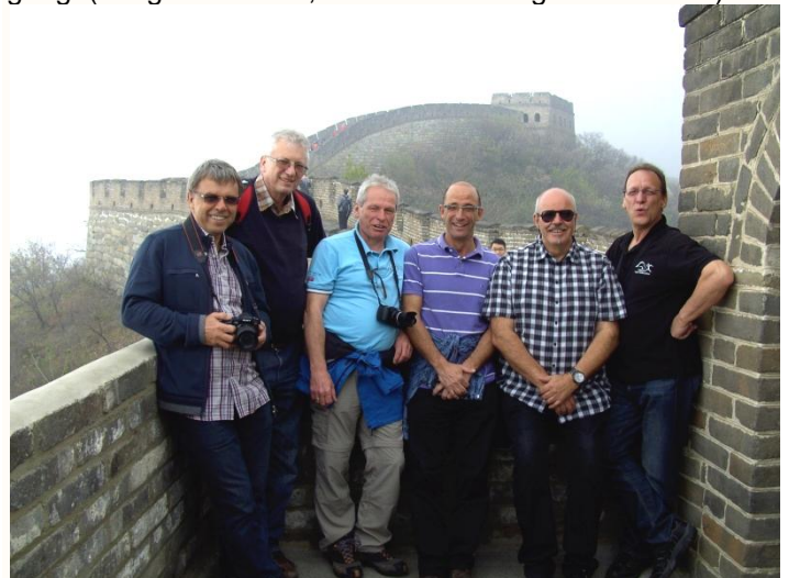
An der chinesischen Mauer bei Peking:

Klar, wir besuchten auch die Wasserstadt Wuzhen, die bekannte Skyline von Shanghai, den grössten stehenden Buddha der Welt in Wuxi (88 m hoch) oder den wunderbaren Garten von Tiger Hill mit dem schiefen Turm und dem Humble Garten mit einem der grössten Bonsai Gärten der Welt. Einfach imposant. Wir waren beim Formel 1 Rennen – „Großer Preis von China“ und fuhren mit der Transrapid, einer Schwebebahn mit 431 km/Std. Höchstgeschwindigkeit. Für 2 Tage sind wir nach Peking geflogen (1200 km von Shanghai entfernt) „Verbotene Stadt“ – Kaiserpalast, Platz des himmlischen Friedens und von dort 1 ½ Stunden zur Chinesischen Mauer, der historischen Grenzbefestigung (Länge 8.851 km, davon 2253 Berge und Flüsse)