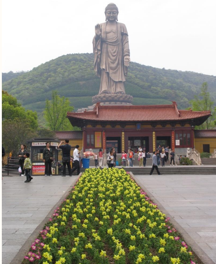
Wuxi: die grösste Buddha-Statue in China (88 m hoch)

Höhe von Agadir in Marokko, Peking auf der Höhe von Madrid, Zeitverschiebung 6 Stunden.