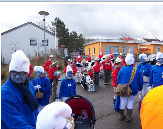
Vor dem Umzug...