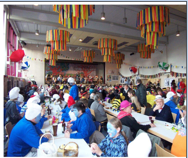
Nach dem Umzug...