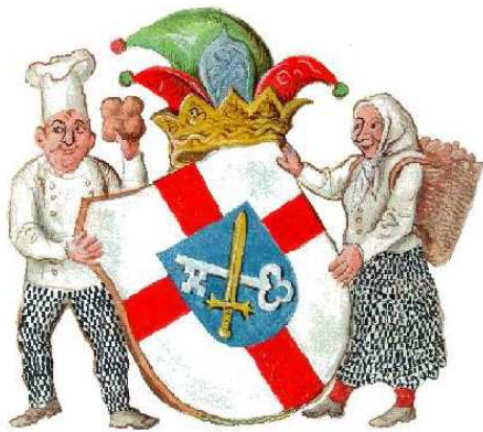
Chrüzerbrötlizunft Überlingen am Ried