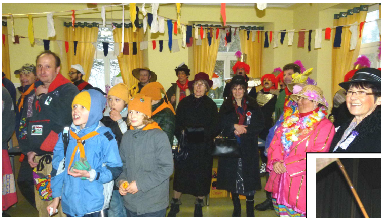
Schmutzige Dunschtig: Rathauserstürmung durch die Narren