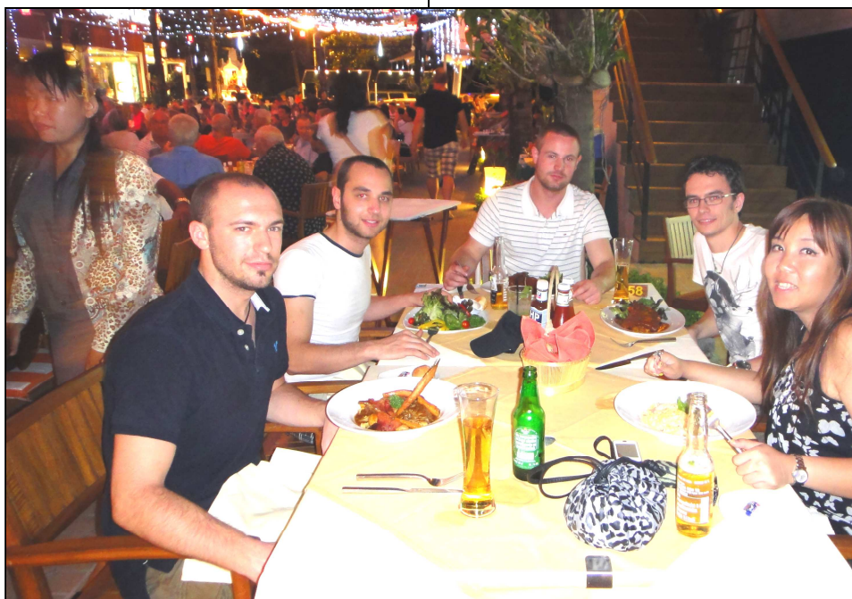
Unten im Kreise der Freunde aus der Heimat.