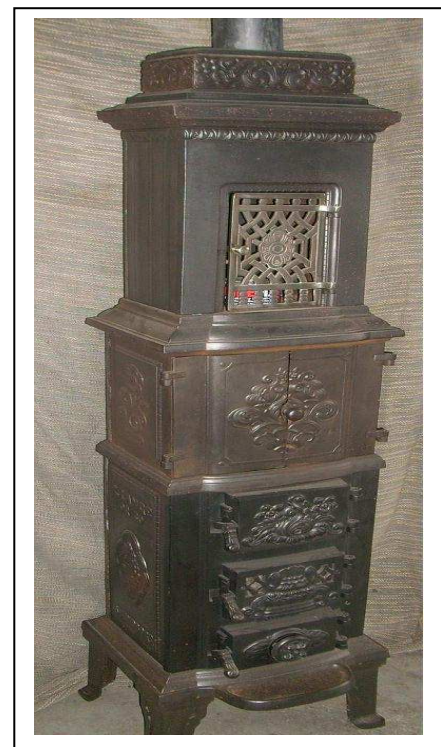
Orig. nord. Kaminofen B/T/H 45x35x170 abzugeben. Bitte melden unter Tel. 07731/21504

Die Sportgaststätte "Siebenschläfer" ist vom 3.1. bis einschl. 17.1. geschlossen.