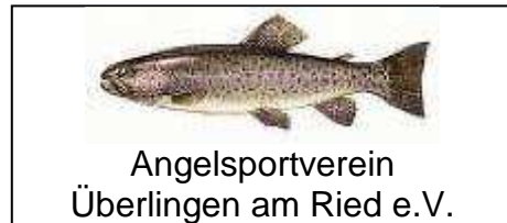
Angelsportverein Überlingen am Ried e.V.