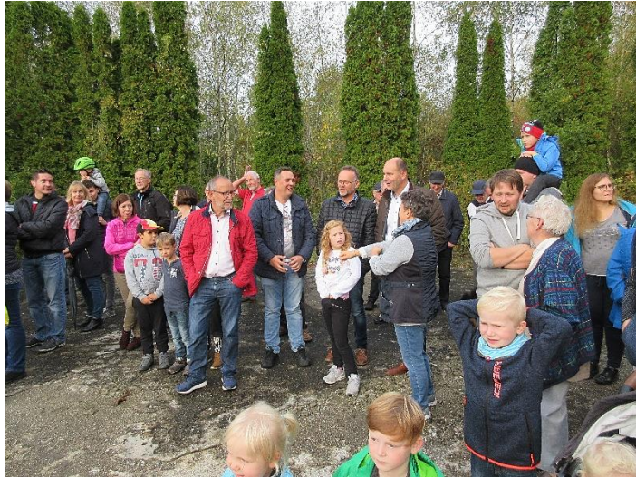
Zahlreiche Zuschauer, auch OB Bernd Häusler beobachteten den Ablauf der Übung

Die Einsatzleitung hat sich über die Lage informiert und die notwendigen Entscheidungen getroffen. Es wurde eine Feuerbekämpfung aufgebaut und ein Atemschutzkommando ging ins Gebäude, brach die Bürotür auf und rettete den Inhaber aus dem Büro. Sofort wurden die Büroräume belüftet, um den Rauch aus dem Gebäude zu bringen.