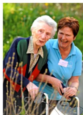
Kath. Landfrauenbewegung und AOK-Pflegekasse

Kurs in Überlingen am Ried Oktober 2019 bis April 2020