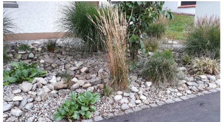
Nach getaner Arbeit ist die Anlage wieder wie neu.

Die erste Aktion von Freiwilligen war also ein voller Erfolg und es stellt sich die Frage, ob sich weitere Personen für solche und ähnliche Projekte zur Verfügung stellen werden. Wir denken maximal an ein oder zwei Einsätze pro Monat für höchstens zwei Stunden, je nach Notwendigkeit. Es muss auch nicht jeder Helfer jedes Mal an den Aktionen teilnehmen. Als kleines Zeichen des Dankes gibt es auch mal ein Vesper und am Jahresende wollen wir die Akteure mit einem kleinen Ausflug mit Essen belohnen.