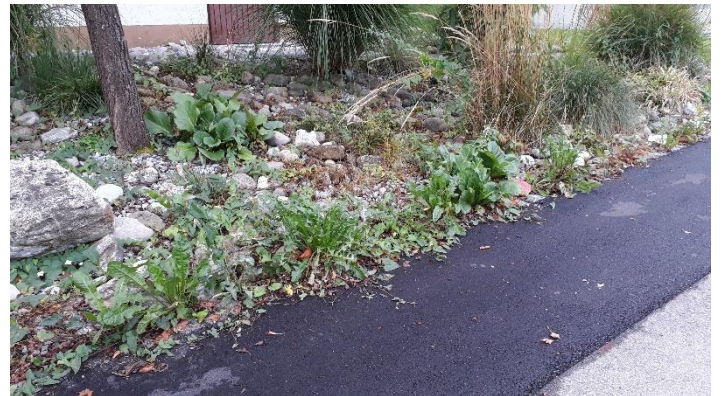
Vor der Aktion war der Steingarten stark verunkrautet...

Ich habe die Frage gestellt, ob dies in Überlingen auch möglich wäre. Daraufhin haben sich fünf Personen gemeldet, die sich an der „Start-up“ Aktion am Mittwoch, 23. September am Feuerwehrhaus beteiligen wollten.