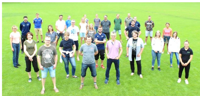
Die Übungsleiter des TSV

Sehr gerne geben wir an dieser Stelle noch einen kurzen Rückblick auf die Zeit vor Corona. Die Fußballer freuen sich seit März über ihr neues Flutlicht auf dem Nebenplatz, ausgestattet mit neuester LED-Technik. Bei vollstän-