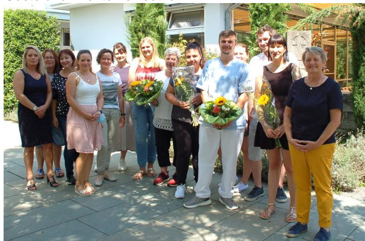
Die frisch gebackenen Altenpflegefachkräfte und Praxisanleiter mit ihren Ausbilderinnen

Das Pflegezentrum freut sich mit den Absolventen über ihre guten Abschlüsse und dass sie nun ihre erworbenen Fachkenntnisse und Fertigkeiten zum Wohle der Bewohner, Gäste und Klienten einsetzen.