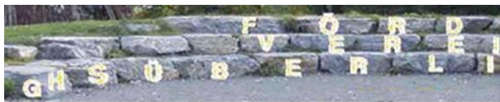
Förderverein der Grundschule Überlingen am Ried

Sehr geehrte Vereinsmitglieder, Sehr geehrte Interessierte und Vereinsfreunde,