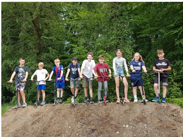
Schon viele Jugendliche aus Überlingen erfreuen sich an der neuen Skateanlage, obwohl die Geräte noch gar nicht installiert sind. Wie auf dem Bild zu sehen ist, wird auch improvisiert