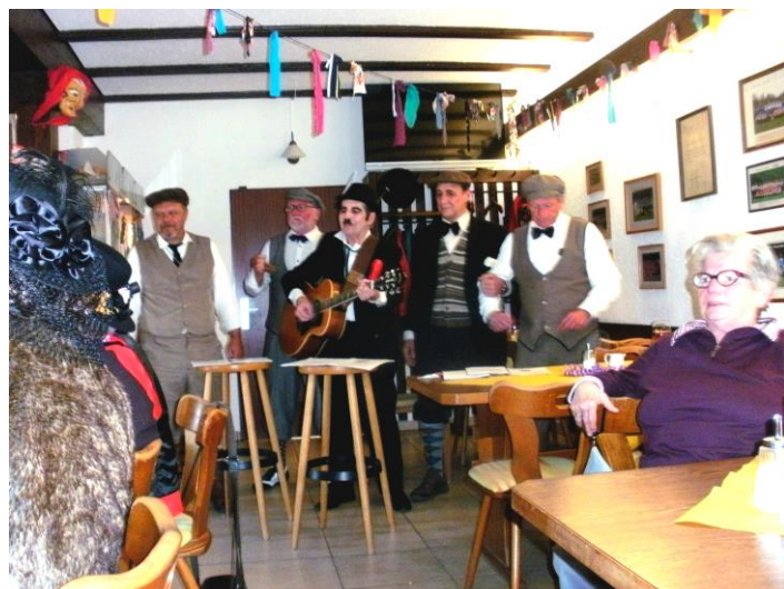
Die Bänklesänger im Siebenschläfer