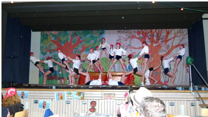
Auftritt am Bunten Abend