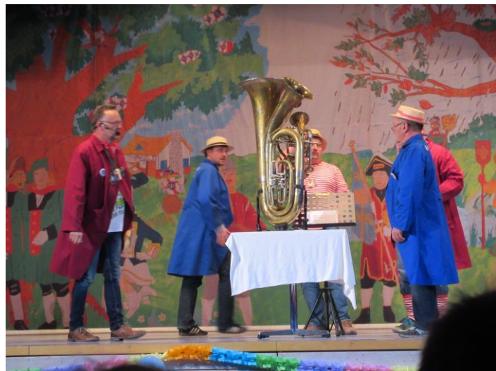
Vier Musiker blasen in Tuba und Horn...