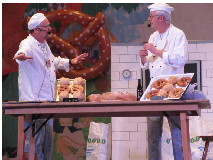
Die traditionelle Bäckernummer am Bunten Abend...