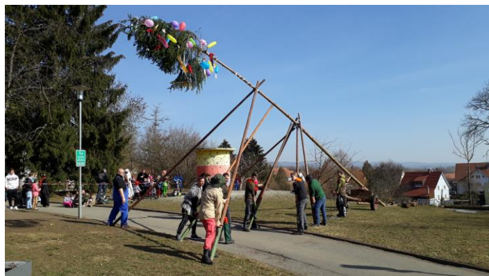
Stellen des Narrenbaums