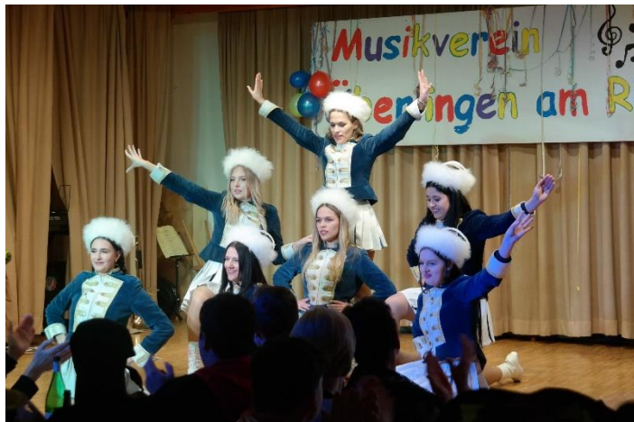
Die Überlinger Garde der Chrüzerbrötli-Zunft Überlingen am Ried

Bevor es tatsächlich in die benötigte kurze Pause ging, folgte der Gardetanz der Überlinger Chrüzerbrötli-Zunft. „Der erste Tanzauftritt in diesem Jahr“, wie man von den jungen Gardemädchen zu hören bekam, wurde gedankt mit viel Beifall. Voller Motivation und jeder Menge Energie merkte man Ihnen die Freude am Tanzen an. Der Funke sprang auf das Publikum sofort über und eine Zugabe durfte hier keinesfalls fehlen.