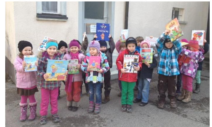
Zu Besuch in unserer Bücherei waren Kindergarten-Kids...

Maiandacht Am Montag, den 06. Mai 2013 um 19.00 Uhr feiern wir gemeinsam mit den Worblinger Frauen eine Maiandacht in unserer Pfarrkirche. Anschließend gemütliches Beisammensein in der Gaststätte „Alte Mühle“.