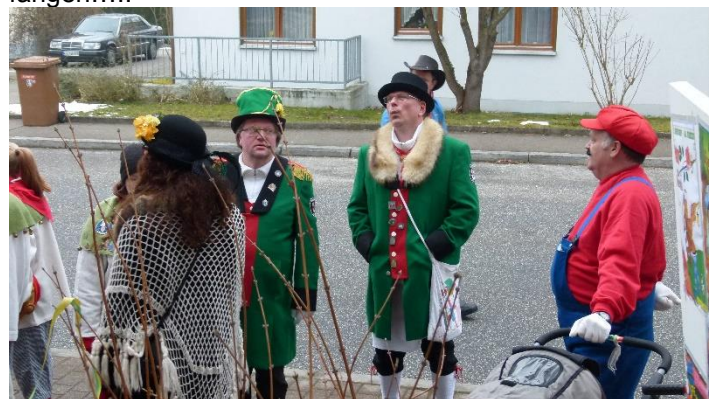
Ratlosigkeit bei den Narren, wie sie wohl ins Rathaus kommen.....