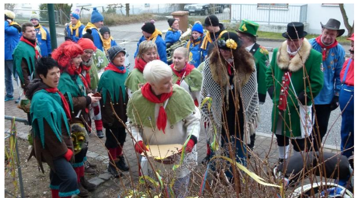
Die Minen hellen sich auf, die Rätsel werden „Stufe um Stufe“ gelöst