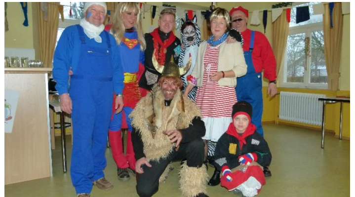
Der Ortschaftsrat ist bereit, die Narren im Rathaus zu empfangen.....